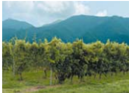
実験農場 (祝村圃場)