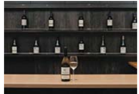
ワインテイスティング カウンタ